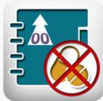
Envío de reporte diario de abasto cero