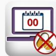
Consulta de reporte diario de abasto cero